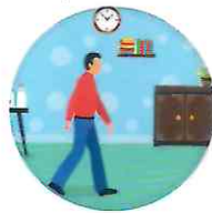
కళ్ళు తెరుస్తూ మూస్తూ గదిలో అటు ఇటు నడవడం