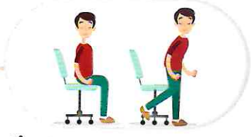
కూర్చోవడం నుంచి నిలబడటం వలరకు చార్జింగ్, మొదట్లో కళ్ళు తెరిచి మరియు అనంతరం కళ్ళు మూసుకొని 1.5 సార్లు వదేవదే చేయాలి