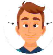
కేంద్రీకరణ వ్యాయామం చేయాలి