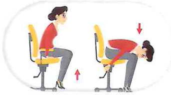
ముందుకు వంగడం మరియు ప్లాగ్ నుంచి వస్తువులు తీయాలి