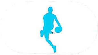
మోకాలు కిందుగా ఒక చేతి నుంచి మరొక చేతికి బంతిని విసరాలి