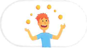
చిన్న బంతిని ఒక చేతి నుంచి మరొక చేతిలోకి విసురుతూ కదులుతున్న బంతిని కళ్ళతో చూడాలి