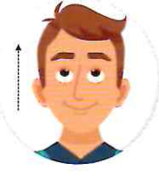
పైకి మరియు కిందకు చూడాలి