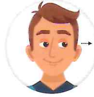
ఎడమకు మరియు కుడికి మార్చిమార్చి చూడాలి