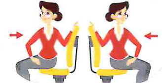
తల మరియు మొండెం మార్చి మార్చి ఎడమకు మరియు కుడికి తిప్పాలి