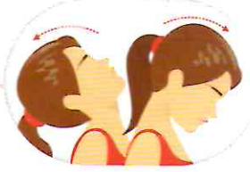
ముందుకు మరియు వెనక్కి మార్చిమార్చి తల వంచాలి