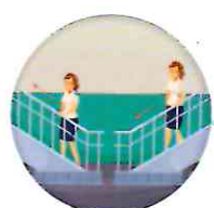
మెట్లు ఎక్కి దిగడం