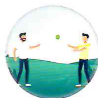
వంగడం, స్ట్రైకింగ్ మరియు ఆల్టింగ్ ఉండే ఏదైనా ఆటను బంతితో ఆడటం