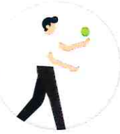
నడుస్తూ బంతిని విసిరి పట్టుకోవడం